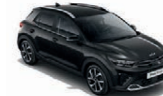
Auroraschwarz Met. (ABP)