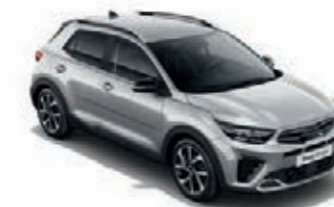
Seidensilber Met. (4SS)