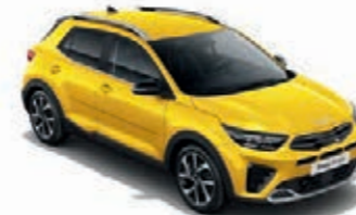
Floridagelb Met. (MYW)