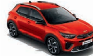
Signalrot Met. (BEG)