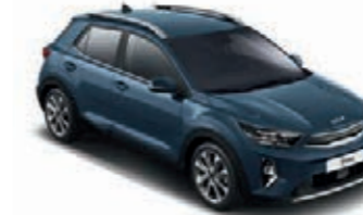
Denimblau Met. (EU3)