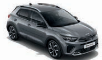
Perennialgrau Met. (PRG)