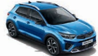
Bathysblau Met. (SPB)