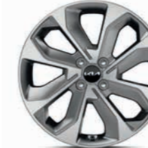
17-Zoll-Leichtmetallfelgen (Spirit und Platinum)